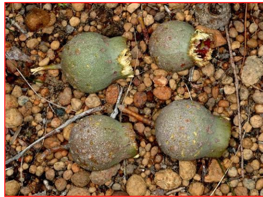
Marrinüsse mit Fraßspuren von Baudins Weißohr-Rabenkakadu

Übersetzung aus den Englischen: Volker F.