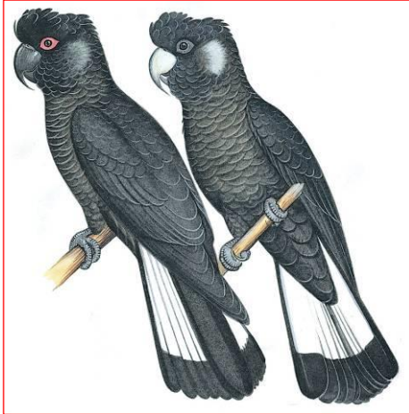
Männchen (links), Weibchen (rechts)